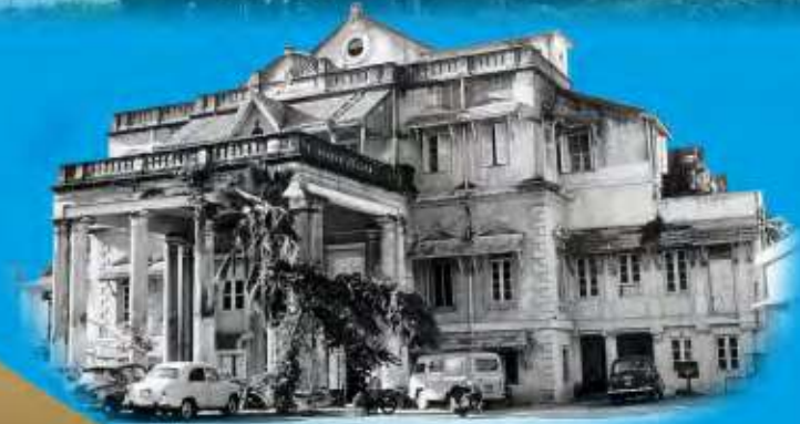
Bank's Head Office, 1958

वार्षिक रिपोर्ट Annual Report 2021 - 2022